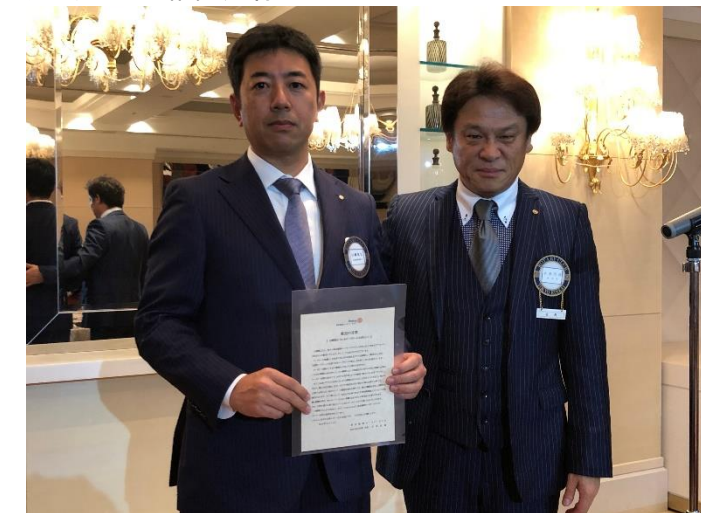
プレゼント抽選会：親睦委員会・SAA委員会